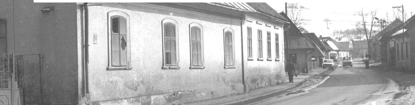
Matušková ulica (1976)

V tomto čísle našich novín pokračujeme zápiskami z mestskej kroniky v roku 1976. Prvý príspevok nám pripomenie, ako obyvatelia Bysterca, bývajúci na vyšších poschodiach, trpeli nedostatkom vody, a čo všetko museli urobiť pre to, aby došlo k náprave. Jelenček v záhrade je obsahom druhého príspevku, ten tretí nám priblíži, ako sa darilo tunajším družstevníkom v roku 1975 a aké boli ich plány do ďalších rokov. Piaty príspevok patrí motoristom, vrátíme sa k populárnym pretekom Rallye Orava a ďalším motoristickým podujatiam, ktoré sú dnes už, bohužiaľ, minulosťou. A minulosťou je aj ženská hádzaná v našom meste, ktorá mala pred polstoročím základňu vedľa futbalového ihriska na Bzinách.