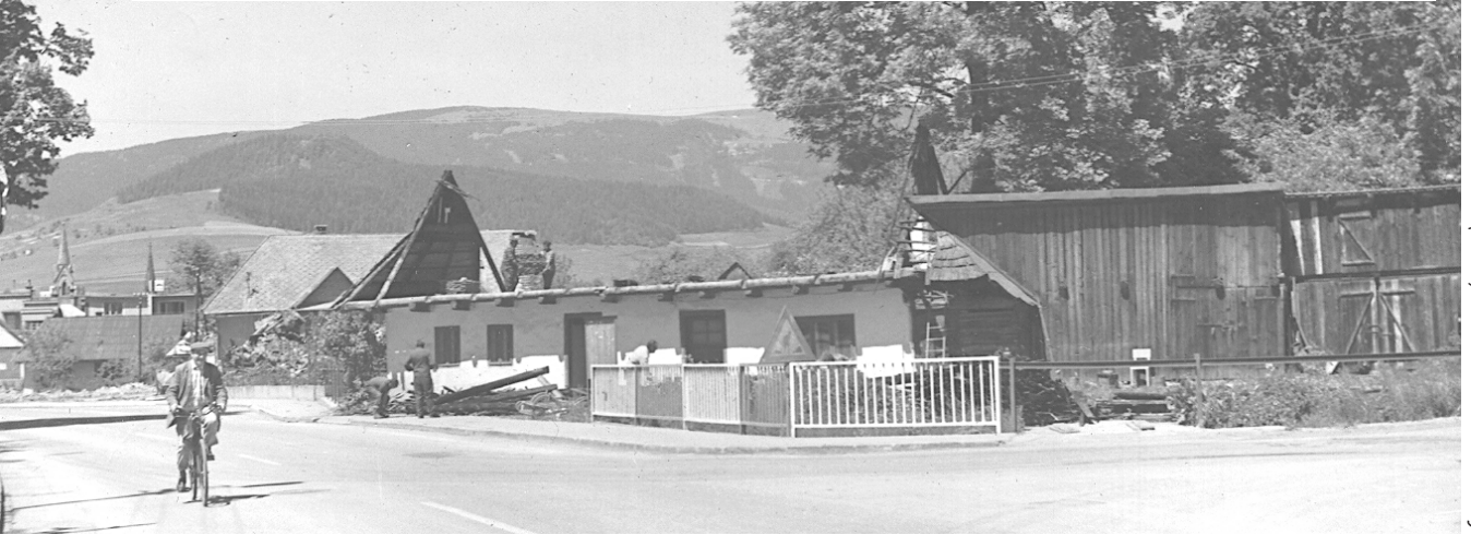
Matúškova (1976).