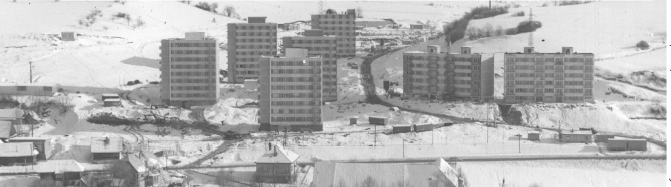
Sídliisko Banisko (1976).

V tomto čísle magazínu Kubín sa po piaty raz vraciame do nášho mesta v roku 1976, tentokrát dvomi témami. Prvou je odpočet činnosti Technických služieb Mestského národného výboru za prvý polrok 1976, druhou témou sú verejné schôdze Komunistickej strany Československa v jednotlivých mestských častiach. Z nich je možné zistiť, aké problémy pred takmer 50 rokmi najviac trápili obyvateľov nášho mesta. Prijemné čítanie a spomínanie.