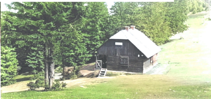
Zreštrúvané hist. snímky